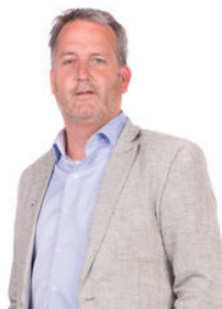
Andre Bunnig Makelaar o.z.

Als lokale experts kennen wij de regio Leiden van binnen en buiten. U kunt bij ons terecht voor al uw vragen en advies met betrekking tot onroerend goed. Wij zijn een servicegerichte organisatie en ondersteunen u bij elke stap van het transactieproces. Van tips om uw huis verkoopklaar te maken tot aan het verzorgen van een naamplaatje voor de nieuwe eigenaar van uw woning. Onze beroemde slogan luidt: "Niemand in de wereld verkoopt meer onroerend goed dan RE/MAX." Laat ons u overtuigen.