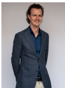
Joost Haman Makelaar o.z.

Als lokale experts kennen wij de regio Leiden van binnen en buiten. U kunt bij ons terecht voor al uw vragen en advies met betrekking tot onroerend goed. Wij zijn een servicegerichte organisatie en ondersteunen u bij elke stap van het transactieproces. Van tips om uw huis verkoopklaar te maken tot aan het verzorgen van een naamplaatje voor de nieuwe eigenaar van uw woning. Onze beroemde slogan luidt: "Niemand in de wereld verkoopt meer onroerend goed dan RE/MAX." Laat ons u overtuigen.