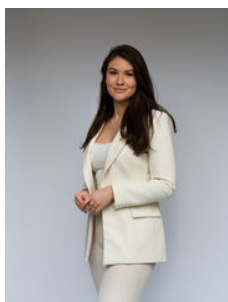
Louise de Jonge Makelaar o.z.

Als lokale experts kennen wij de regio Leiden van binnen en buiten. U kunt bij ons terecht voor al uw vragen en advies met betrekking tot onroerend goed. Wij zijn een servicegerichte organisatie en ondersteunen u bij elke stap van het transactieproces. Van tips om uw huis verkoopklaar te maken tot aan het verzorgen van een naamplaatje voor de nieuwe eigenaar van uw woning. Onze beroemde slogan luidt: "Niemand in de wereld verkoopt meer onroerend goed dan RE/MAX." Laat ons u overtuigen.